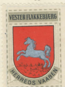
Vester Flakkebjerg Herred